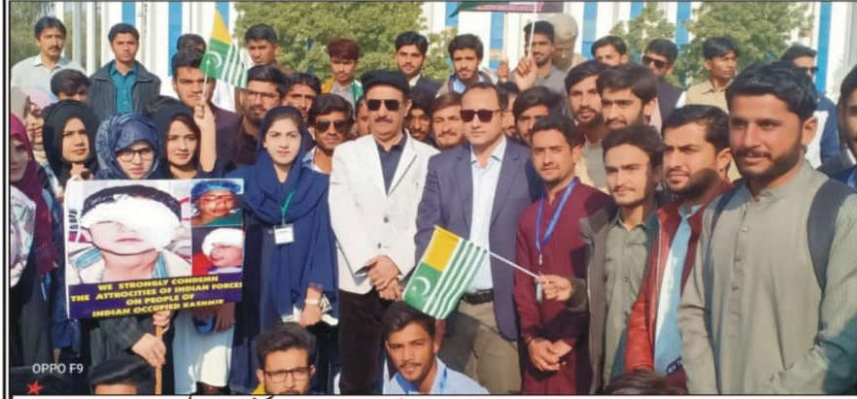
حیدرآباد۔ پاکستان اسٹیڈی سینٹر سندھ یونیورسٹی جامشورو کی جانب سے یوم کشمیر پر ریلی نکالی جا رہی ہے