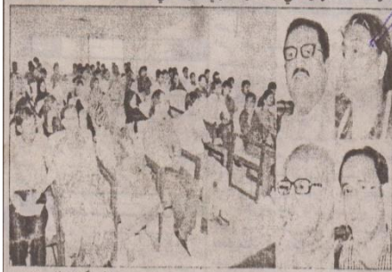
ڄامشورو: سنڌ يونيورسٽي ۾ پاڪ-چين راهداري منصوبي بابت سيمينار ڪي اڳواڻ خطاب ڪندي

جلد 19 | اڱارو 23 آگسٽ 2016ء بمطابق 19 ذوالقعدة 1437 هجرتي | سنڌ يونيورسٽي ۾ سي پيڪ منصوبي بابت سيمينار منعقد